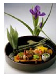
料理に添えて季節感や清潔感を出すもの

かいしきの制作包装・梱包作業、道後温泉のホテル・旅館への配達など当サロンが主体となって運営している。