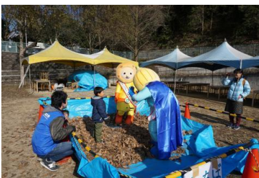
▲③落ち葉プールの様子