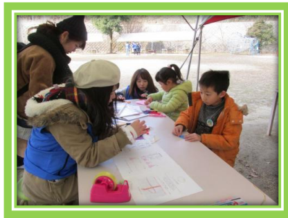
▲⑤体験コーナーの様子