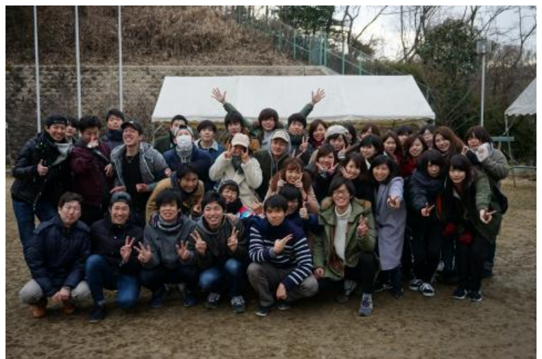
☆横見ゼミナール全員集合!!!