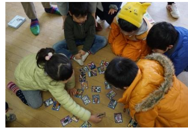
▲②なわてフェスカルタ大会の様子