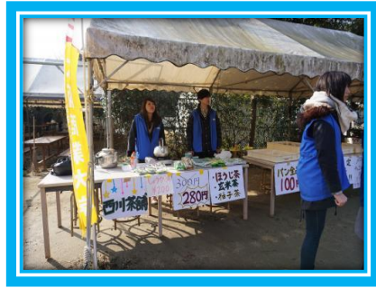
▲⑥休憩コーナーの様子

④交流コーナーは、このイベントのメインとなるコーナーです。午前中には、開会式を行い、ご当地キャラクター、四條畷市のシンボルマーク「なわ丸」の紹介をしました。また、なわてロードガイド「ゆずりは」様と市役所の方にも挨拶をしていただき、四條畷市の魅力について語っていただきました。午後には、四條畷市に関する「〇×クイズ」や、いま流行りの「恋ダンス」を踊り、みんな笑顔で楽しんでいました。