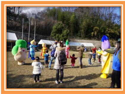
▲④交流コーナーの様子