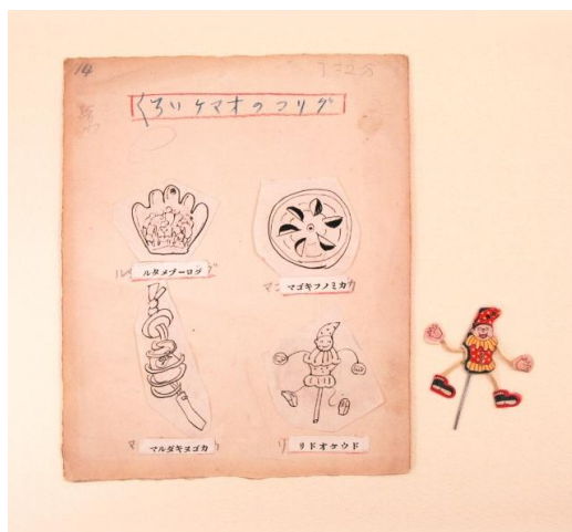
グリコのおもちゃとデザイン画(1935年頃)