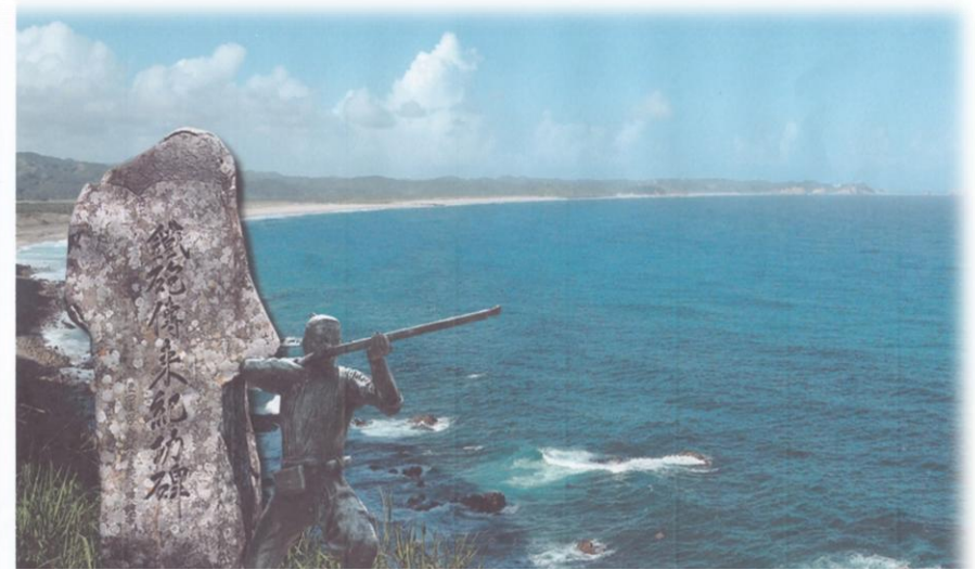
【種子島開発総合センター鉄砲館 所蔵】

問合せ先 ：河内の郷土文化サークルセンター事務局 (大阪商業大学 谷崎記念館内) 〒577-8505 東大阪市御厨栄町4-1-10 TEL 06-6785-6139 FAX 06-6785-6237