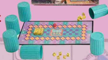
ライアーズ・ダイス