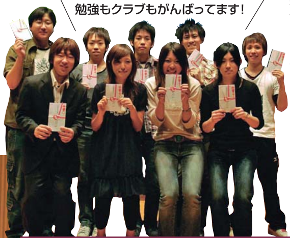
勉強もクラブもがんばってます!

発行 大阪商業大学スポーツセンター 編集 大阪商業大学スポーツセンター 印刷 株式会社日本ビジネスアート