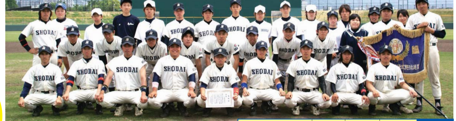
全国切符にはあと一歩及ばず...

リーグ代表として全国切符を目指して挑んだ関西選手権大会ならびに関西地区2次トーナメントでは惜しくも敗戦を喫し、全国大会へあと一歩及ばなかった。 しかしながら基本的な準硬式野球部は毎年学生達自身が主体となっていてチームを作り上げている。その中で今回の成績は他クラブ等にも非常に良い刺激になりとても立派な成績である。