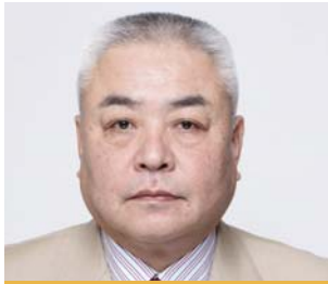
女子バレーボール 柳本 晶一監督 (1970年大阪商業大学高等学校卒業)