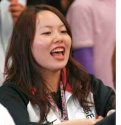
リーグ戦最終戦で優勝がかった試合。応援にも熱が入ります!

近所に高級スーパーになりたくてもなれないスーパーがある。とにかくなんでも聞けば丁寧だと思っただけで、「ネギはお切りしましょうか?」「袋はひとついいですか?それとも2つにわけますか?」「ジュースは横に入れてもいいですか?」などなどこれ見よがしなサービスを売り込んでくる。先日ピンクグレープフルーツ2個とホワイトグレープフルーツを1個買ったときにはこんなことを言われた。「このグレープフルーツは白いので美味しいのではありませんか?」ピンクと白を2:1の割合で好きでいいなかったでしょうか? 恩着せがましいサービスは一切行わないスポーツセンターから、「商大スポ」創刊号をこれ見よがしにフルカラーでお届けしました。