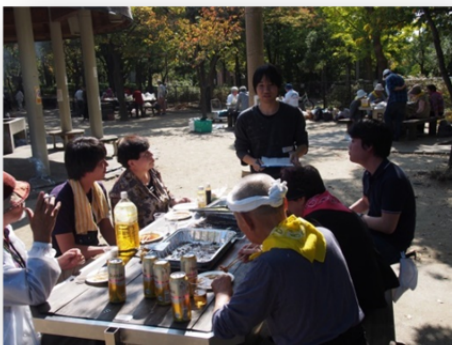
利用者さんとバーベキューイベント

半径 500m 以内にスーパーがないと「買い物難民」が発生しやすいようです。近大周辺において買い物に困っている人々をイオン店に導くプロジェクトを試験的に実施しています。10 カ月間で 400 名を超える人々を導びました。持続可能性のある支援のあり方を模索しています。