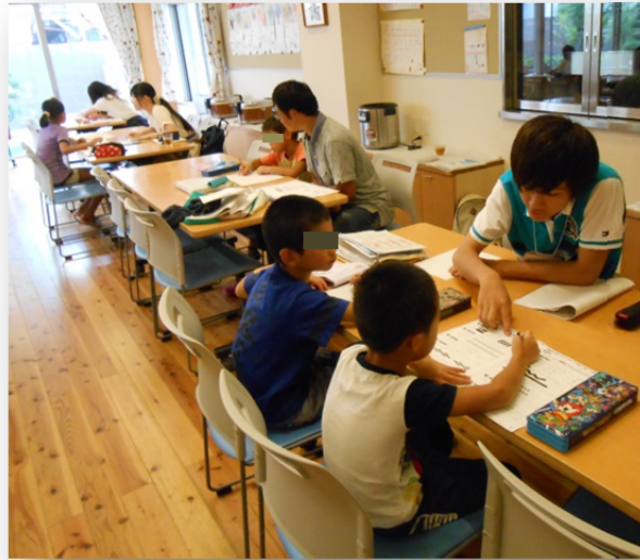
児童養護施設での様子