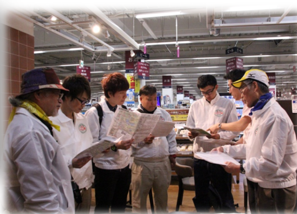
イオン店内にて打ち合わせ