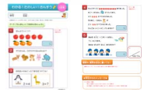
開発中の教材の一部