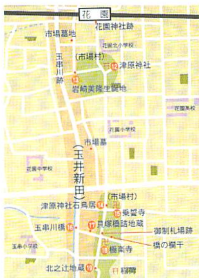
玉串地域の史跡と文化財

花園の地名については、近世において津原神社周辺は市場村花園辻と呼ばれていました。神社の周りに桜が多く植えられたことによるようです。旧字名に「花屋敷」がありました。