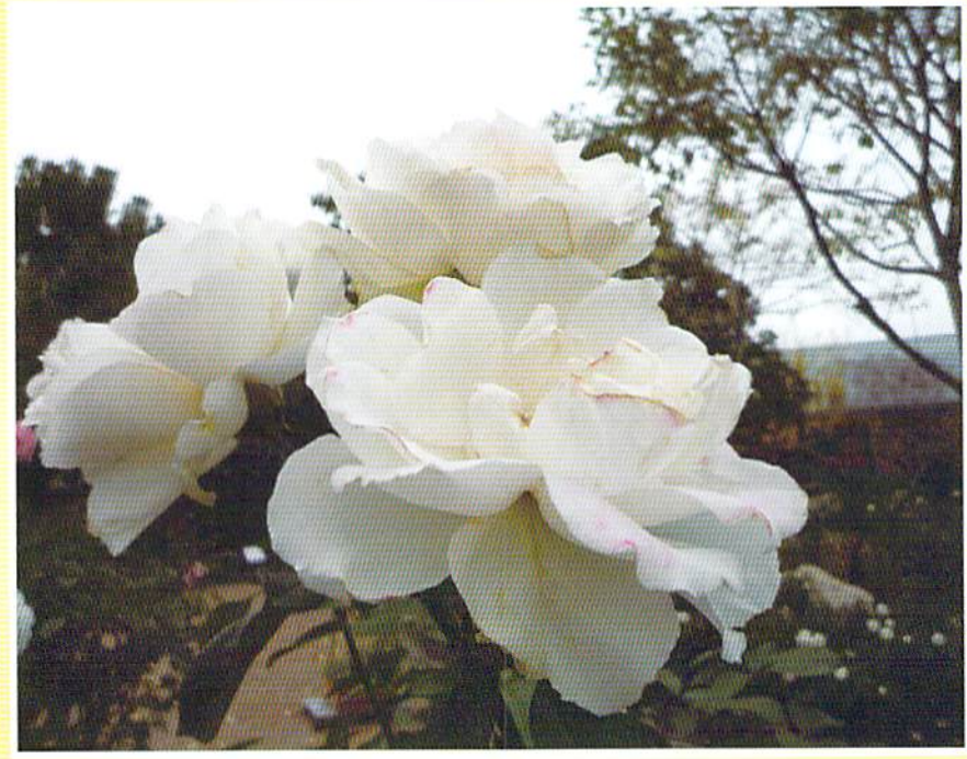
バラ「プリンセス・オブ・ウェールズ」(会員親睦旅行において撮影)

第60号 発行 平成 23 年 10 月 公益社団法人 東大阪市シルバー人材センター 会報編集委員会 〒577-0809 東大阪市永和1丁目15番2号 06(6224)2408 FAX06(6224)2409 E-mail higasic@ninus.ocn.ne.jp ホームページ http://www4.ocn.ne.jp/higasic/