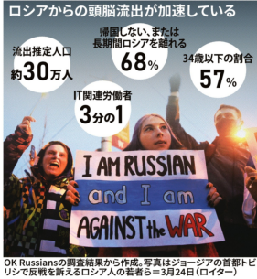
OK Russiansの買収結果から作成。写真はジョージアの首都トビリシで反戦を訴えるロシア人の若者ら(3月24日(ロシア))

ロシアからの頭脳流出が加速している。流出推定人口約30万人、68%は34歳以下の割合、57%は1年間労働者3分の1。ITや金融、経済長期低迷へ