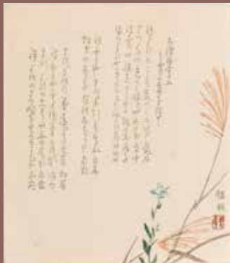
俳諧一枚摺(鼎左、左栗他)