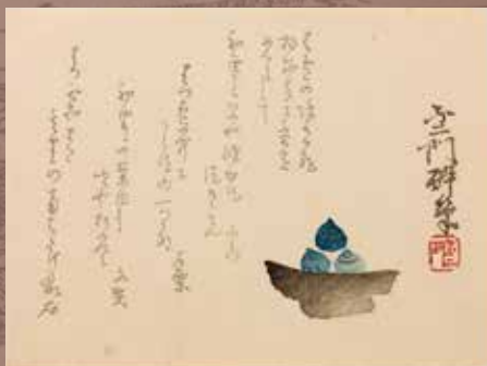
俳諧一枚摺(左栗・鼎左他)