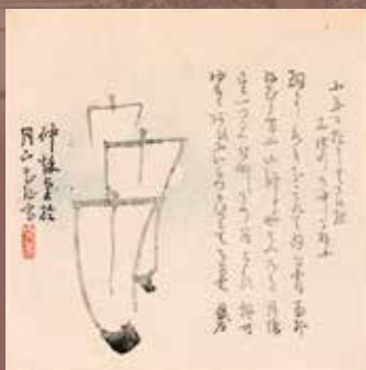
俳諧一枚摺(鼎左他)