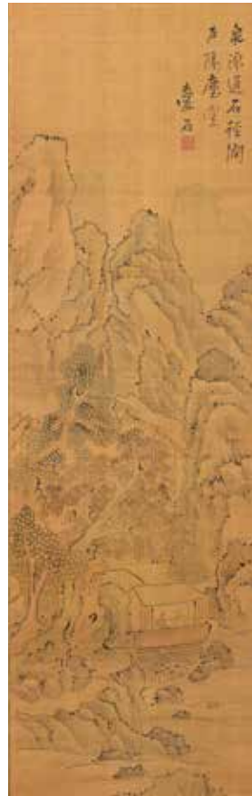
愛石「高士山水図」個人蔵