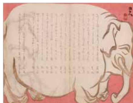
俳諧一枚摺（鼎左他）

㊥ 大阪商業大学ユニバーシティ・commons re-Act 南館1 階地域交流ルーム 1