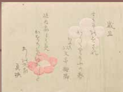
俳諧一枚摺(梅隣・貞興)