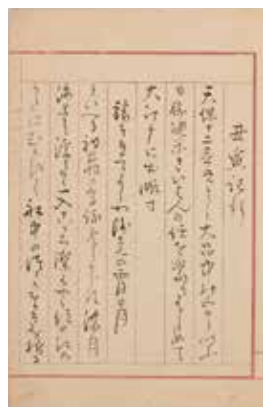
丑寅記行 柏原市立歴史資料館蔵