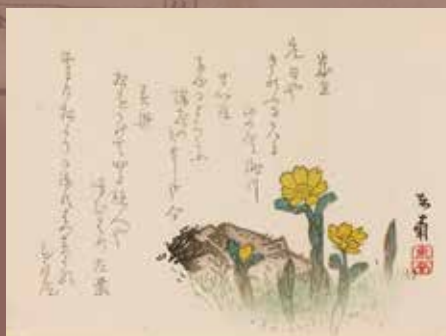
俳諧一枚摺(左栗、花屋庵他)