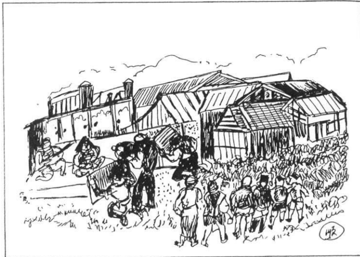
小阪撮影所ロケ風景と見学者 (宮本順三画)

来ていたことなど、日常生活に映画の世界が大きく占めていた。お礼にもらった入場券で両親や友人と映画館(小阪座)へ。映画好きの原点は、河内小阪にあった。現代劇の帝キネ芦屋撮影所(『籠の鳥』が大ヒット)に対して、時代劇中心の小阪撮影所が閉鎖された後、長瀬に敷地面積約一万坪の撮影所が誕生した。かまぼこ型のステージなど近代的な設備で、「東洋のハリウッド」と呼ばれた。