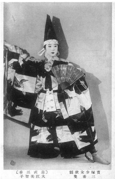
【番三式劇】 劇歌女少塚寶 子智美江大 雙番三

父が小学校四年生の時、大阪市内から布施町（現東大阪市）菱屋西へ引っ越した頃、帝国キネマ小阪撮影所があった。チャンバラごっこに夢中になった少年時代、活動写真の英雄は目玉の松ちゃんこと尾上松之助、そのあとを継いでモモちゃんこと市川百々之助が少年達のあこがれとなった。その百々之助の撮影風景を間近に見ることが出来て、活動写真の面白さにはまってしまう。自宅の隣人が女優の初代大江美智子（女剣劇）だった。宝塚歌劇団にいた大江美智子を映画に引き抜いた市川右太衛門（代表作『旗本退屈男』、北大路欣也の父）も小阪に住んでいたこと、川向かいの土堀に囲まれた延命寺や、当時、長瀬川沿いにあった松並木で映画撮影した後、休憩所として自宅に女優さんが