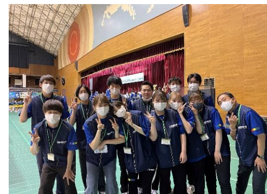
参加したゼミ生全員集合