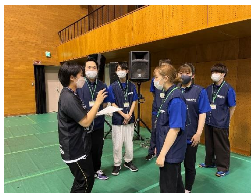
試合開始前の打ち合わせ

多くの参加者があり忙しかったが、迫真の試合を間近でサポートでき、有意義であった。