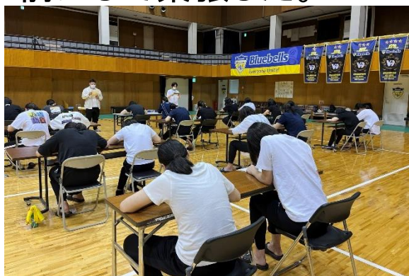
ゼミ生2人が前で 検査説明中

心理検査は、ゼミで分析し、1人1人の性格特性に合ったアドバイスを加えた個人票を作成し、フィードバックした。