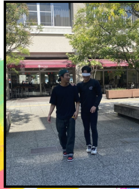
ブラインドウォーク体験