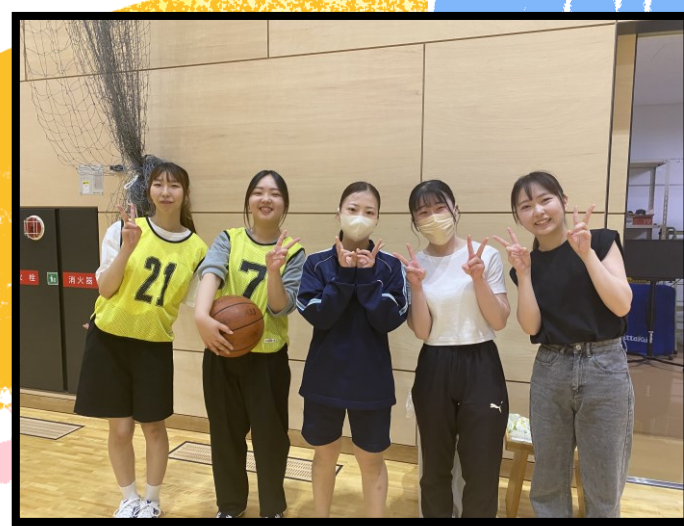
ゼミ内レクリエーション大会