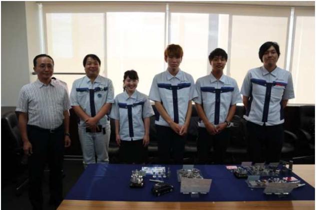
▼商品ディスプレイ①