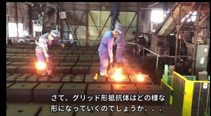
さて、グリッド形抵抗体はどのような形になっていくのでしょうか...