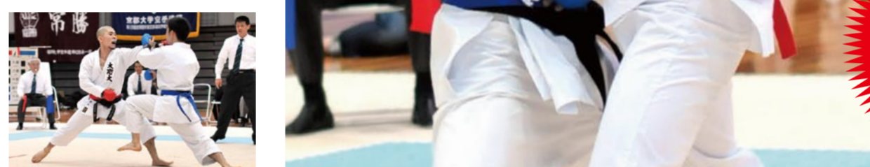
空手道【団体】の試合。団体はあらかじめ対戦前に提出した先鋒・次鋒・中堅・副将・大将の5名で戦います。それぞれが対戦し、勝敗数が決定。勝敗数が分けたときは、総ポイント数で争われます。

大勢の内には、大商大の勢が押し込まれた。しかし、大商大は最後まで粘り、3位の成績を挙げた。これは、チームの士気を高めた。